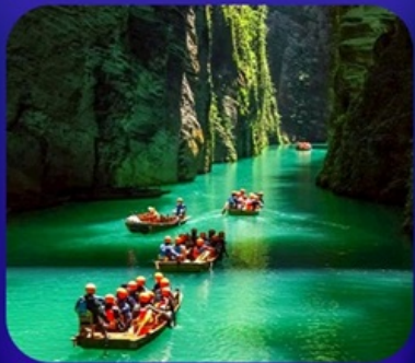
“ ผิงซานแกรนด์แคนยอน ”

เที่ยวจีน 2 มณฑล เสฉวน+หูเป่ย์ • ถ้ำเกิ่งหลง • หุบเขาสิงโต ซื่อจื่อกวน ล่องเรือมังกรกังซู่ชมวิวยามค่ำคืน • ผิงซานแกรนด์แคนยอน (รวมล่องเรือ) หงหยาดัง • จุดชมรถไฟฟ้าทะลุติ๊ก • ตึกตะเกียบ • สือปาตี้ • หลงเหมินฮ่าว