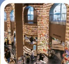
"ห้างสรรพสินค้าจงซูเก๋อ"