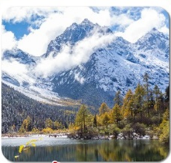
"ปี้เผิงโกว"

ชมความงาม 2 อุทยาน • สี่ดรุณี ของเฉียวโกว + ปี้เผิงโกว • พระใหญ่เล่อซาน สะพานหนานเจียว น้ำตาสีฟ้า • ห้างสรรพสินค้า จงซูเก๋อ • แพนด้ายักษ์บนอนเซลฟ์ ชอยกว้างชอยแคบ • ถนนคนเดินชุนซีลู่ • แพนด้ายักษ์ปิ่นตึก • ถนนคนเดินจินหลี่