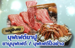
เมนูพิเศษ บุฟเฟ่ต์ข้าว ชาบูบุฟเฟ่ต์ / บุฟเฟ่ต์บิงย่าง