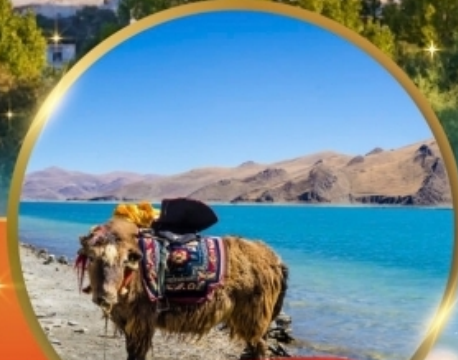
ทะเลสาบยัมดรก

"ธิเบต" เมืองมหัศจรรย์หลังคาโลก พระราชวังฤดูหนาวโปตาลา วิวสุดอลังการคาโนล่ากลาเซียร์ อันซีนทะเลสาบศักดิ์สิทธิ์ "ทะเลสาบยัมดรก" พระราชวังโนร์บุลึงกา • วัดต้าเจา วัดที่ศักดิ์สิทธิ์ที่สุดในธิเบต • ตลาดบาคอรี