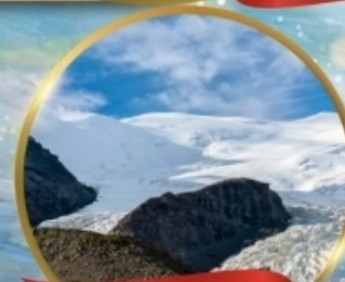
ธารน้ำแข็งคาโนล่า