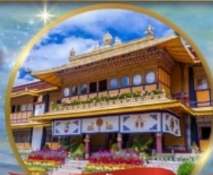
พระราชวัง โนร์บุลึงกา