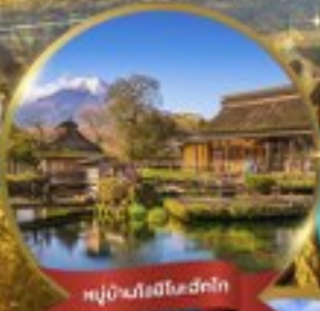
หมู่บ้านโองิโนะฮักโก