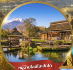
หมู่บ้านโอชิโนะซึกโก