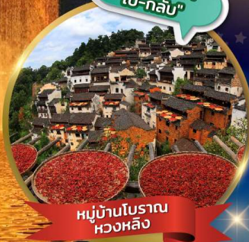
หมู่บ้านโบราณ หวงหลิง