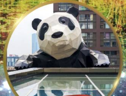
แพนด้ายักษ์

มหัศจรรย์ความงาม อุทยานจิวจ้ายโก (รวมรถเหมาเที่ยวอุทยานเต็มวัน) ชมอุทยานหวงหลง (รวมกระเช้า) • สี่ฤดู • อุทยานชวงเจียวโก (รวมรถอุทยาน) เมืองเก๋าชงพาน • ถนนคนเดินจินหลี่ + ไท่กูหลี่ • ชมแพนด้ายักษ์ป็นตึก