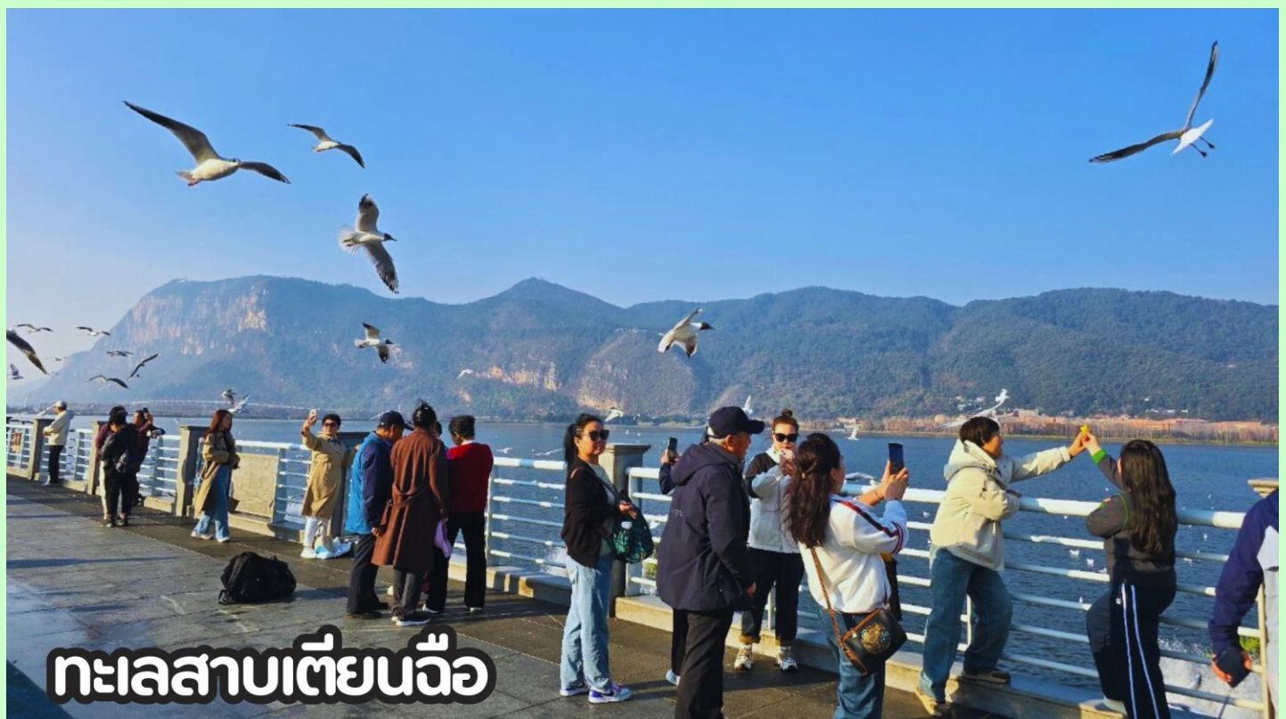
ทะเลสาบเตียนฉือ

**สำหรับท่านที่ไม่ต้องการซื้อออฟชั่นเสริม สามารถอิสระช้อปปิ้งที่ถนนคนเดินใกล้เคียงกันได้**