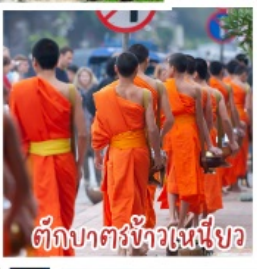
ตักบาตรข้าวเหนียว