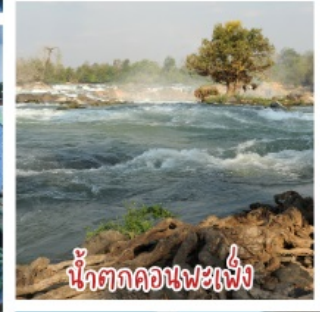
น้ำตกคอนพะเพ็ง