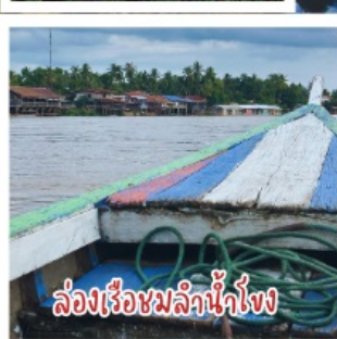
ล่องเรือชมลำน้ำโขง