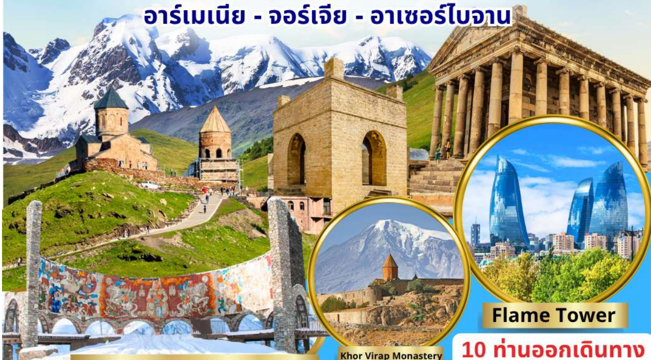
Georgian-Russian Friendship Monument