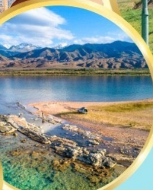
ล่องเรือทะเลสาบอิสซิค