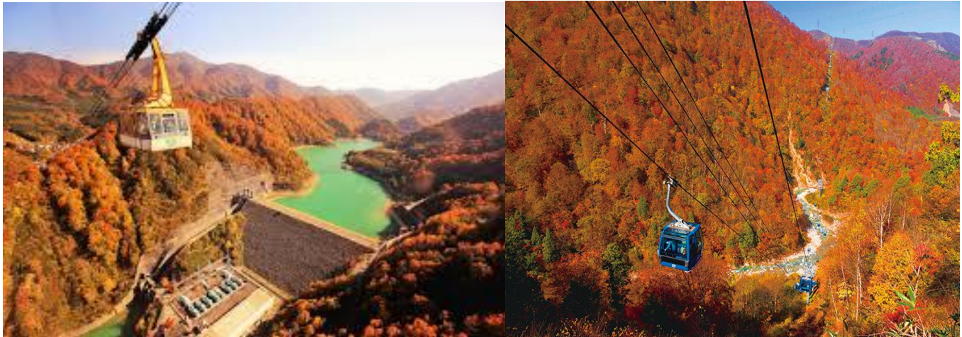
ของบริเวณโดยรอบ

Yuzawa Kogen Ropeway เป็นกระเช้าลอยฟ้าขนาดใหญ่ระดับโลกที่รองรับได้ถึง 166 คน ใช้เวลาเดินทางเพียง 7 นาทีบนเส้นทางราว 1,300 เมตรเชื่อมต่อระหว่างตีนเขากับ Panorama Park ที่อยู่เหนือระดับน้ำทะเลกว่า 1,000 เมตร หน้าสถานีพานoram่าบนยอดเขานั้นเป็นบริเวณที่มีบ่อแช่เท้าและระเบียงกลางแจ้ง ทั้งยังเชื่อมต่อกับ Kumo no Ue Cafe คาเฟ่ที่สามารถผ่อนคลายได้อย่างสบายๆ พลาชมวิวดูตอลังการของที่ราบ Uonuma และเทือกเขา Tanigawa ที่แผ่กว้างอยู่เบื้องหน้า Panorama Park เป็นบริเวณที่มีการแบ่งออกเป็นหลายโซน สามารถเพลิดเพลินไปกับกิจกรรมที่หลากหลาย เช่น การโหนซิปไลน์หรือการเดินป่าพลาชมทิวทัศน์สุดอลังการ