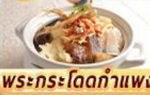
พระกระโดดกำแพง