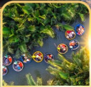
นั้งเรือกระดัง