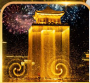
ชมโชว์อุหนี่โจว