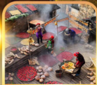
หมู่บ้านโบราณหวงหลิง