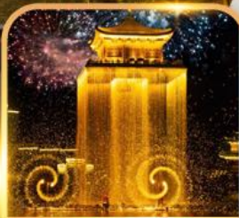
ชมโชว์อุ๊หนี่โจว