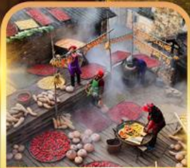
หมู่บ้านโบราณหวงหลิ่ง