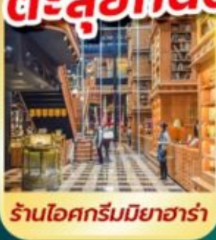
ร้านไอศกรีมมियाฮาร่า