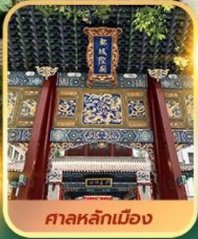
ศาลหลักเมือง