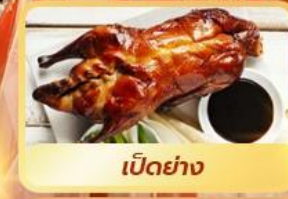
เป็ดย่าง