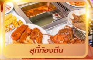
สุกี้ท้องถิ่น