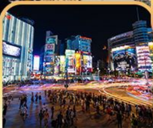
ย่านซีเหมินติง