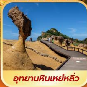
อุทยานหินเหย์หลิว