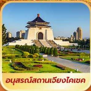
อนุสรณ์สถานเจียงไคเช็ค