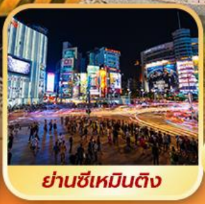
ย่านซีเหมินติง