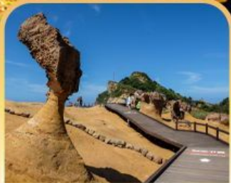
อุทยานหินเหย์หลิว