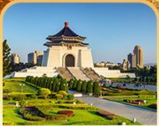
อนุสรณ์สถานเจียงไคเช็ค

เดินทาง 02 - 06 พ.ย. 67 05 - 09 พ.ย. 67 09 - 13 พ.ย. 67 16 - 20 พ.ย. 67 30พ.ย. - 04 ธ.ค. 67