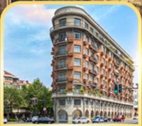
อาคารอู่คัง