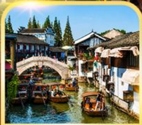
เมืองโบราณซูเจียเจี้ยว