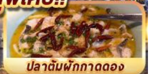
ปลาต้มพริกทอดดอง