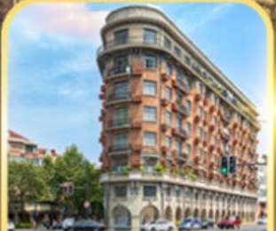
อาคารอู่คัง