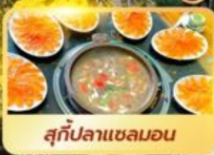
สุกัปลาเซลมอน