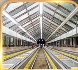
บันไดเลื่อนหวงกวน