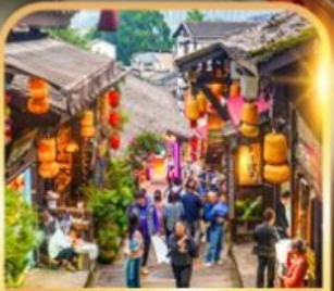
หมู่บ้านโบราณฉือชี่ฮั่ว