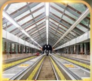
บันไดเลื่อนหวงกวน