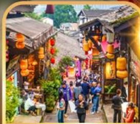
หมู่บ้านโบราณฉือชี่โซ่ว