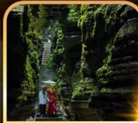
อุทยานเอ็นซือพูหย่า