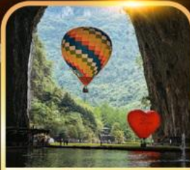
ท่าเกิงหลง