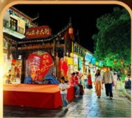
เมืองเทพริดาตุ่เจีย