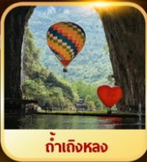
ท่าเกิ่งหลง