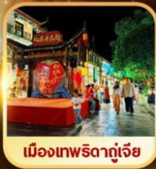
เมืองเทพริดาตู้เจีย