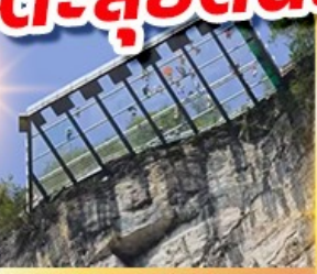
ระเบียงแก้วอุหลง