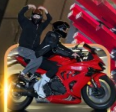
ถ่ายวีดีโอนั่งมอเตอร์ไซด์

ชิมหม้อไฟหม่าล่า นั่งรถรางชมธรรมชาติ หนาวเสียวระเบียงแก้ว