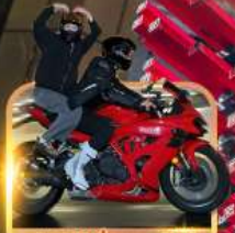
ถ้าขี้รถได้นั่งมอเตอร์ไซด์

ชิมหม้อไฟหม่าล่า นั่งรถรางชมธรรมชาติ หวาดเสียวระเบี่ยงแก้ว