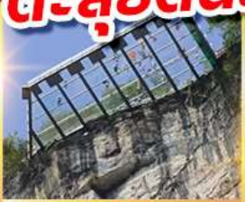
ระเบี่ยงแก้วอุ๋หลง