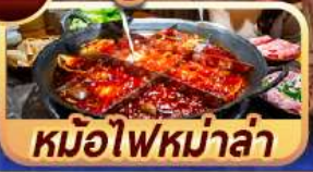
หม้อไฟหม่าล่า