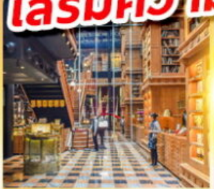
ร้านไอศกรีมมียาฮ่า