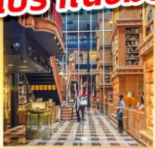
ร้านไอศกรีมมียาฮาร์