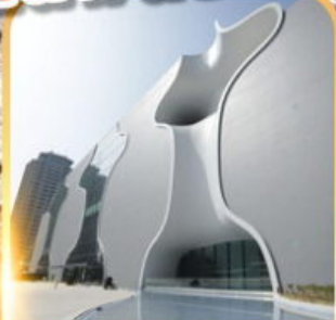
โรงละครไถจง