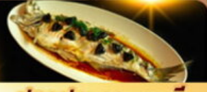
ปลาประรานาบดี