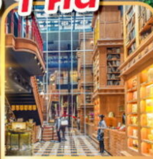
ร้านไอศกรีมมียาฮารา