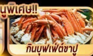
กินบุฟเฟ่ต์ซาบู