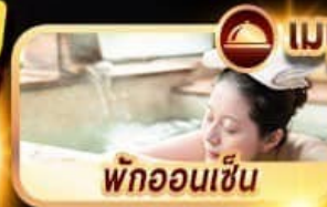
พักออนเซ็น