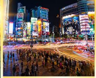
ซีเหมินติง