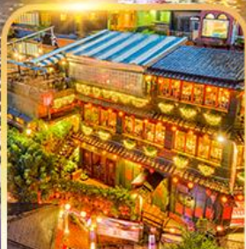
หมู่บ้านจิวเฟิน