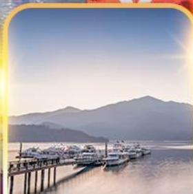
ทะเลสาบสุริยันจันทรา