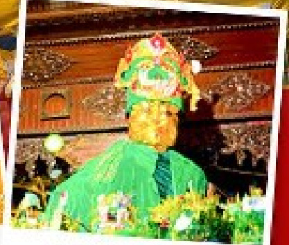
ขอพรแม่ยักษิ