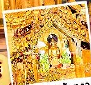
พระสุริยอินจันตรา