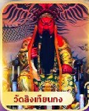
วัดสิงเกียนกง