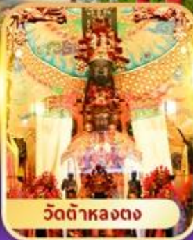
วัดต้าหลงตง