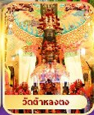
วัดต้าหลงตง