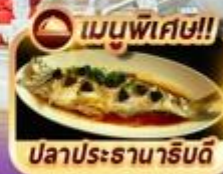
ปลาประจานาริบดี