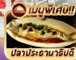
เมนูพิเศษ!! ปลาประธนาจีนดี