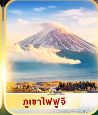
ภูเขาไฟฟูจิ