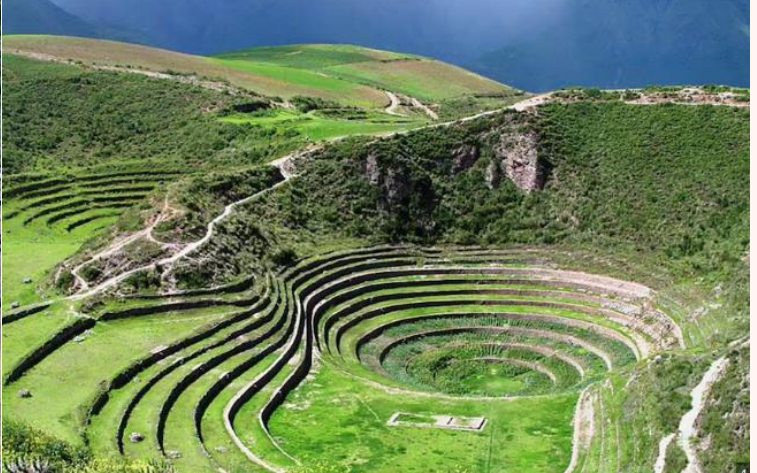
บ่าย นำท่านเดินทางสู่ มาราซ (Maras) แหล่งผลิตเกลือที่คุณภาพดีที่สุดในโลก ที่มีมาตั้งแต่สมัยอินคา แนวนาขั้นบันไดที่เรียงอยู่ตามลำดับความสูงของภูเขา จากนั้นเดินทางสู่ โมเรย์ (Moray) นาขั้นบันไดวงกลมขนาดใหญ่หลายๆรูปร่างแปลกตาที่ชาวอินคาทำไว้เพื่อทดลองปลูกพืชพันธุ์ต่างๆ จากจุดนี้สามารถมองเห็น หมู่บ้านอูรัมบัмба (Urubamba) ได้อีกด้วย ได้เวลาเดินทางกลับสู่เมือง เมืองคัสโก (Cusco) เมืองหลวงของอาณาจักรอินคา ที่แพร่ขยายอาณาจณกินพื้นที่ 1 ใน 3 ของอเมริกาใต้ ตั้งอยู่เหนือระดับน้ำทะเลถึง 3,400 เมตร และเป็นแหล่งอารยธรรมยุคก่อนประวัติศาสตร์ที่ลึกลับน่าทึ่ง เป็นชุมชนเก่าแก่ของจักรวรรดิอินคาอันรุ่งเรือง ซึ่งยังคงทิ้งร่องรอยความเจริญไว้ให้เห็นเป็นซากปรักหักพังโบราณและโบราณวัตถุต่างๆ