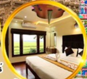
ล่องเรือซาฟารีเปรियาร์