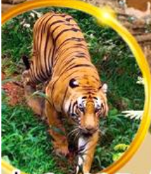
ล่องเรือซาฟารีเปรियาร์