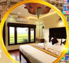
พักบ้านเรือลิมพัชรรมชาติ