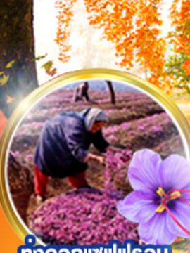
ทุ่งดอกแซฟฟรอน