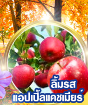
ลิ้มรส แอปเปิ้ลแคชเมียร์