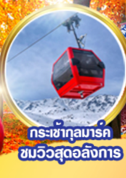
กระเช้ากุลมาร์ค ชมวิวสุดอลังการ