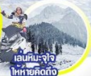
เล่นหิมะ-จิว ไหวหทัยคิดถึง