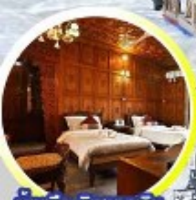
บ้านเรือ..วิมานบนดิน