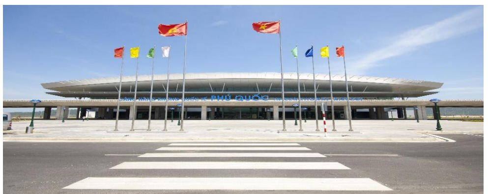
PHU QUOC (สนามบินพูก๊วกประเทศเวียดนาม)