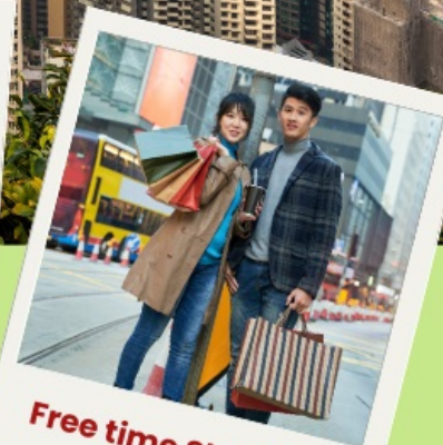
Free time Shopping