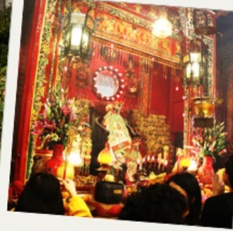
วัดเจ้าแม่กวนอิมฮ่องกง