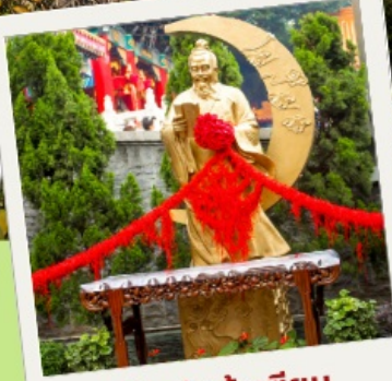
วัดหวังต้าเซียน