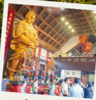
วัดแชกงหมิว