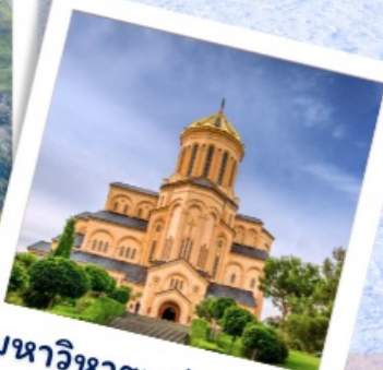
มหาวิหารแห่งทบิลีซี