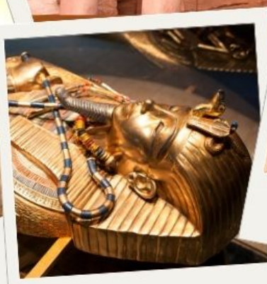
พิพิธภัณฑ์สถานแห่งชาติอียิปต์