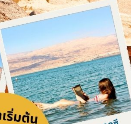
ทะเลสาบเดดซี