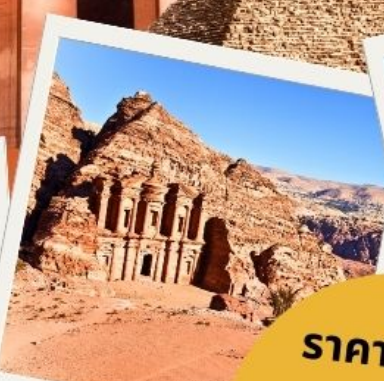
เพตรา นครศิลาสีชมพู