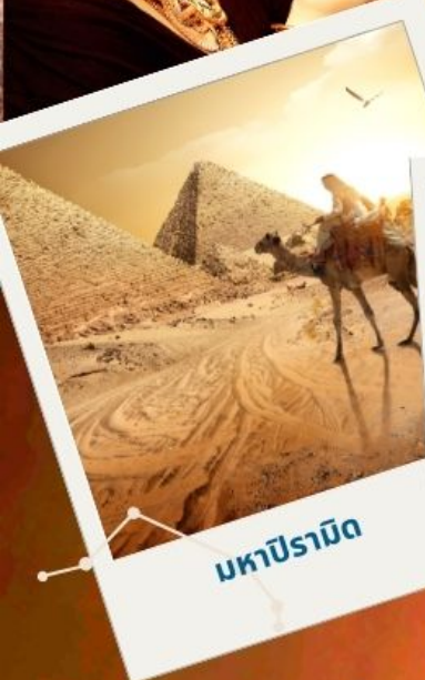
มหาปิรามิด