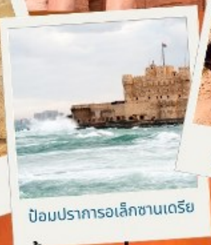
ป้อมปราการอเล็กซานเดรีย