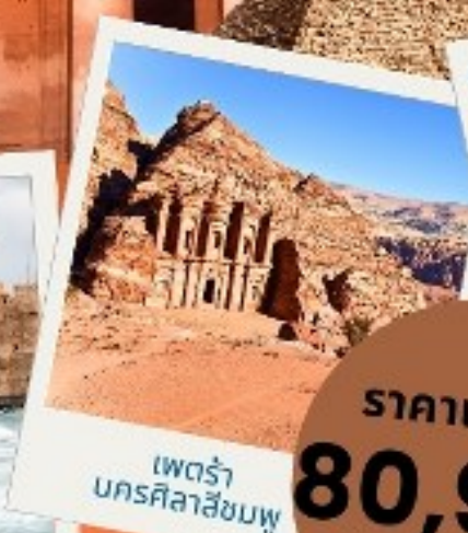
เพตรา นครศิลาสีชมพู