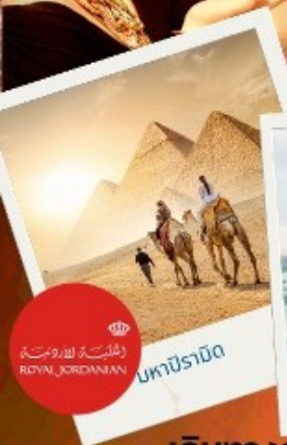
มหาปิรามิด