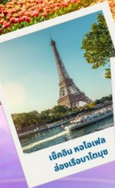
เขคอิน หอไอเฟล ล่องเรือมาโทมุซ

เทศกาลดอกไม้ เคอเคนฮอฟ 2024 เนเธอร์แลนด์ เบลเยียม ฝรั่งเศส