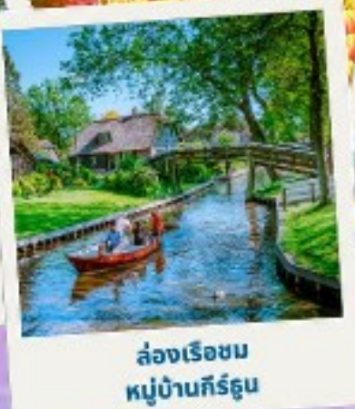
ล่องเรือชม หมู่บ้านกิร์ดุน