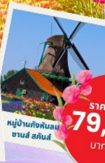
หมู่บ้านกังหันลม ซานส์ สคันส์