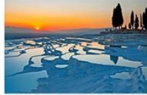
ปามุคคาเล่

** พักที่ RICHMOND THERMAL HOTEL 5* หรือเทียบเท่า **