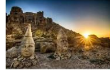
ชมพระอาทิตย์ขึ้น