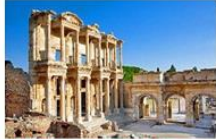
เมืองโบราณเอเฟซุส