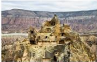
นครใต้ดิน