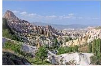
หมู่บ้านของนกพิราบ