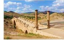
สะพานเซเวอร์ริน

19.20 น. เห็นฟ้าสู่นครอิสตันบูล โดยเที่ยวบิน TK 2215