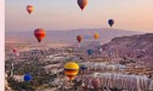
คัปปาโดเกีย

** พักที่ DEDELI CAVE HOTEL 5* หรือเทียบเท่า **