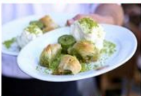
ชิมไอศกรีมตุรกีต้นกำเนิด Nemrut Mountain