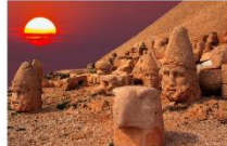
ชมพระอาทิตย์ตกดิน