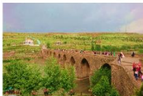
สะพานสิบโค้ง