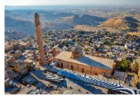
เมืองมาร์ดิน

**ที่พักรที่ KAYA NINOVA MARDIN HOTEL **