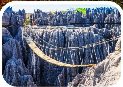
อุทยานแห่งชาติซิงกี เดอ เบอมาราฮา