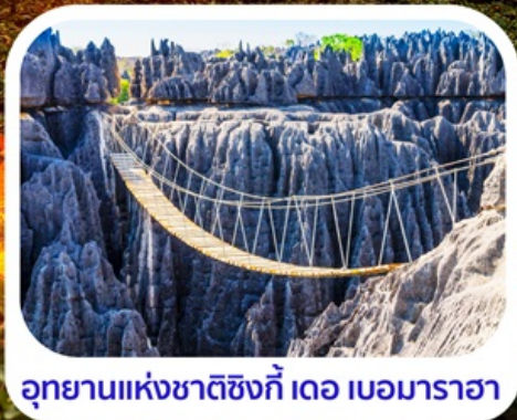
อุทยานแห่งชาติซิงกี เดอ เบมาราฮา