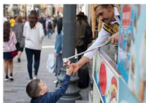
ไอศกรีม Maraş ชมพระอาทิตย์ตกดิน ณ ภูเขาเนมรุต