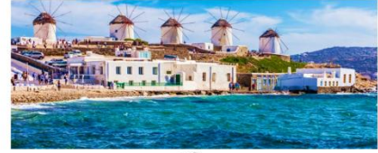
เกาะมิโคนอส

** พักที่ Camarades Hotel 4* หรือเทียบเท่า **