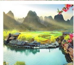
เมืองลิบไค