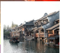
เมืองโบราณผานหลงกู่จีน